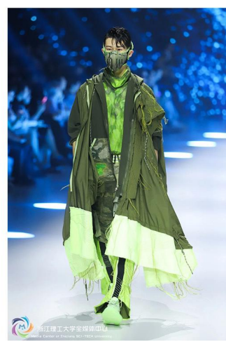
2019年服饰设计专业毕业作品